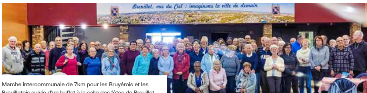
Marche intercommunale de 7km pour les Bruyérois et les Breuilletois suivie d'un buffet à la salle des fêtes de Breuilletois.