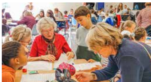
La dictée intergénérationnelle a rassemblé 5 classes d'élémentaire et une dizaine de seniors autour d'un texte sur le Taj Mahal. Félicitations à tous les participants !