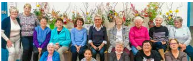
Direction le Japon avec un atelier Ikebana, art floral dans lequel la composition est une œuvre vivante et où l'homme et la nature se rencontrent.