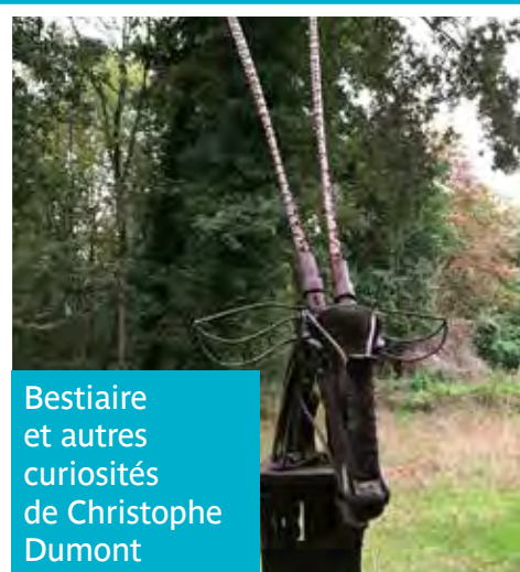
Bestiaire et autres curiosités de Christophe Dumont