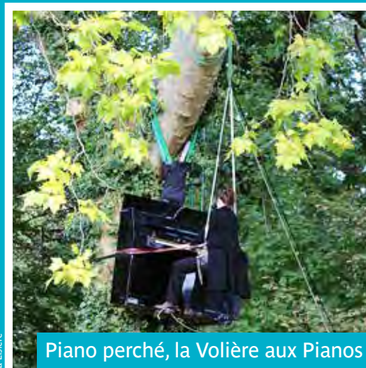
Piano perché, la Volière aux Pianos