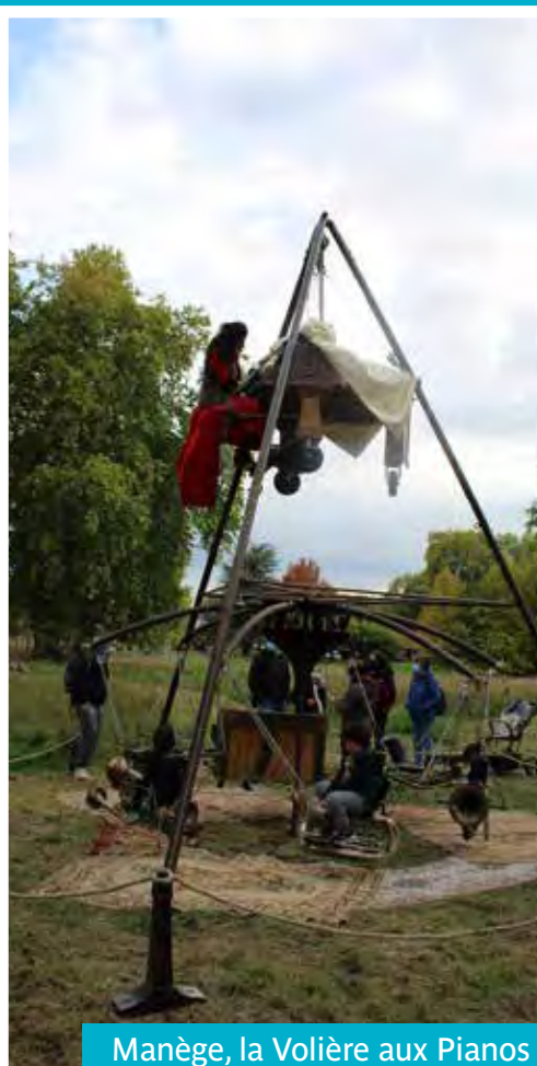
Manège, la Volière aux Pianos