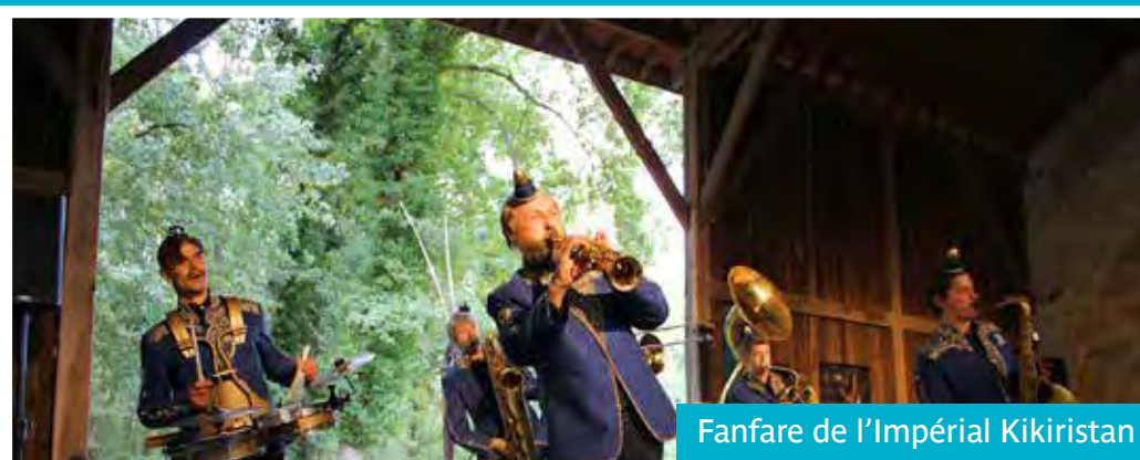
Fanfare de l'Impérial Kikiristan