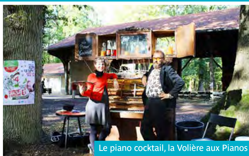
Le piano cocktail, la Volière aux Pianos