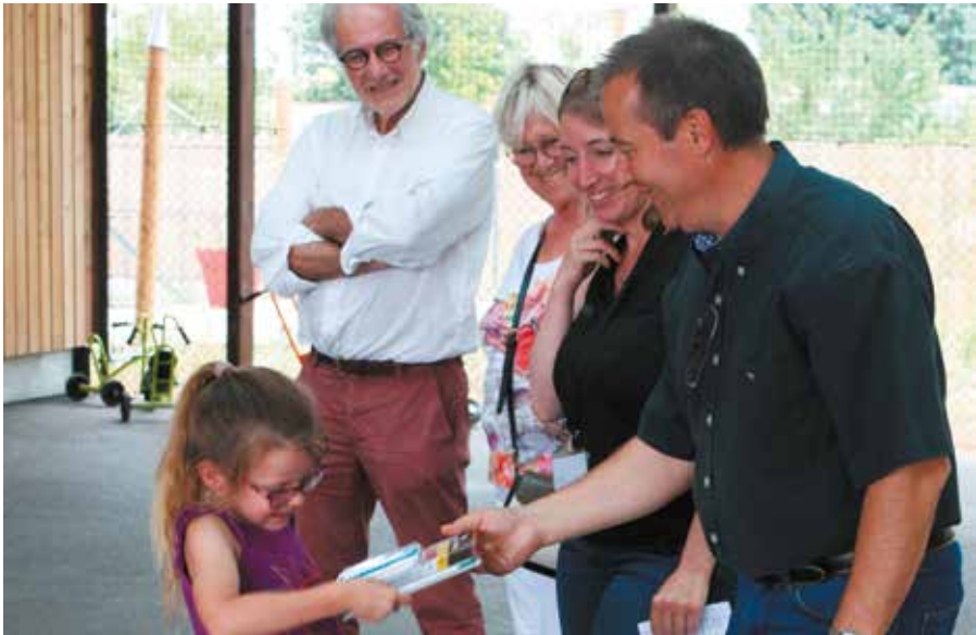
Remise des récompenses au pôle éducatif.