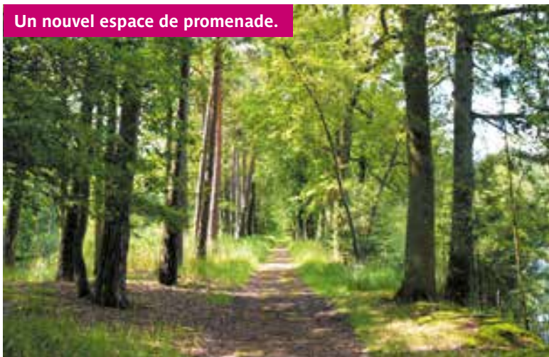
Un nouvel espace de promenade.