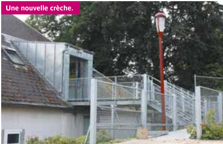
Une nouvelle crèche.