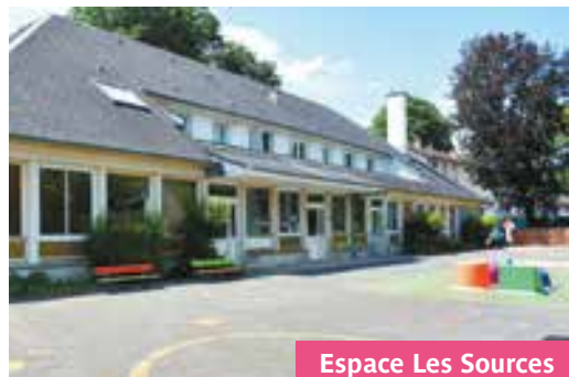
Espace Les Sources