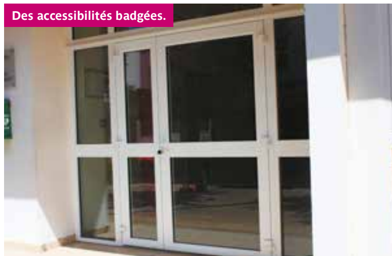
Des accessibilités badgées.