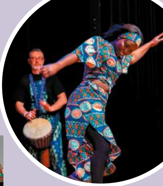
FESTIVAL DES ARTS AFRICAINS Retour en images