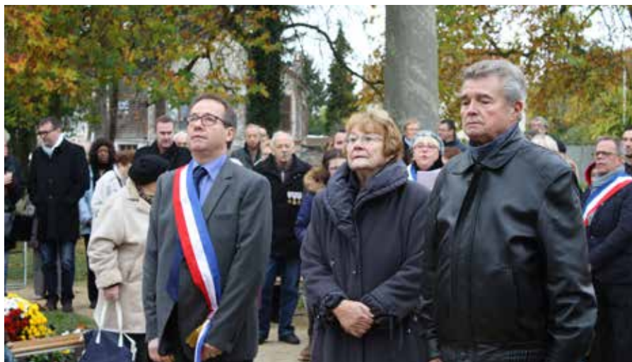
Cérémonie du 11 novembre.

“ Mesdames, Messieurs, Notre commune, comme toutes les autres, a l'obligation de rendre accessible aux personnes à mobilité réduite l'ensemble des circulations piétonnes. Avec les contraintes actuelles qui pèsent fortement sur les finances locales nous saisissons évidemment toutes les opportunités pour répondre à nos obligations.