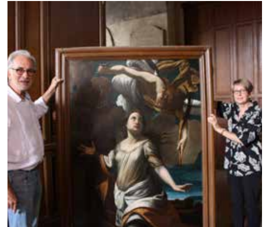
« L'annonce du martyre de Sainte Catherine d'Alexandrie » reposé le 13 septembre 2016.

Depuis 2012, la municipalité s'est associée à la Fondation du Patrimoine d'Ile-de-France pour restaurer le mobilier et les œuvres de l'église Saint-Didier. La deuxième phase de restauration est terminée. Trois tableaux ont été restaurés pour un montant de 27 817 €. Dans le cadre de cette convention, d'autres œuvres sont à restaurer : le buste de Sainte Catherine, les tableaux « la Vierge à l'enfant », « le baptême du Christ », « Saint Didier », un crucifix en bois, la bannière de la Vierge et une statue de procession pour un montant de 22 222 €.