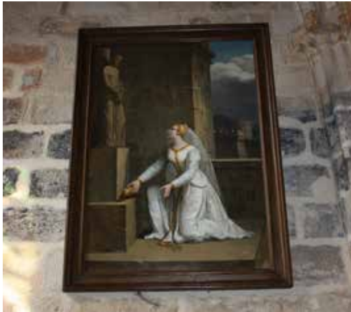
« Sainte Catherine d'Alexandrie » reposé le 24 juin 2015.