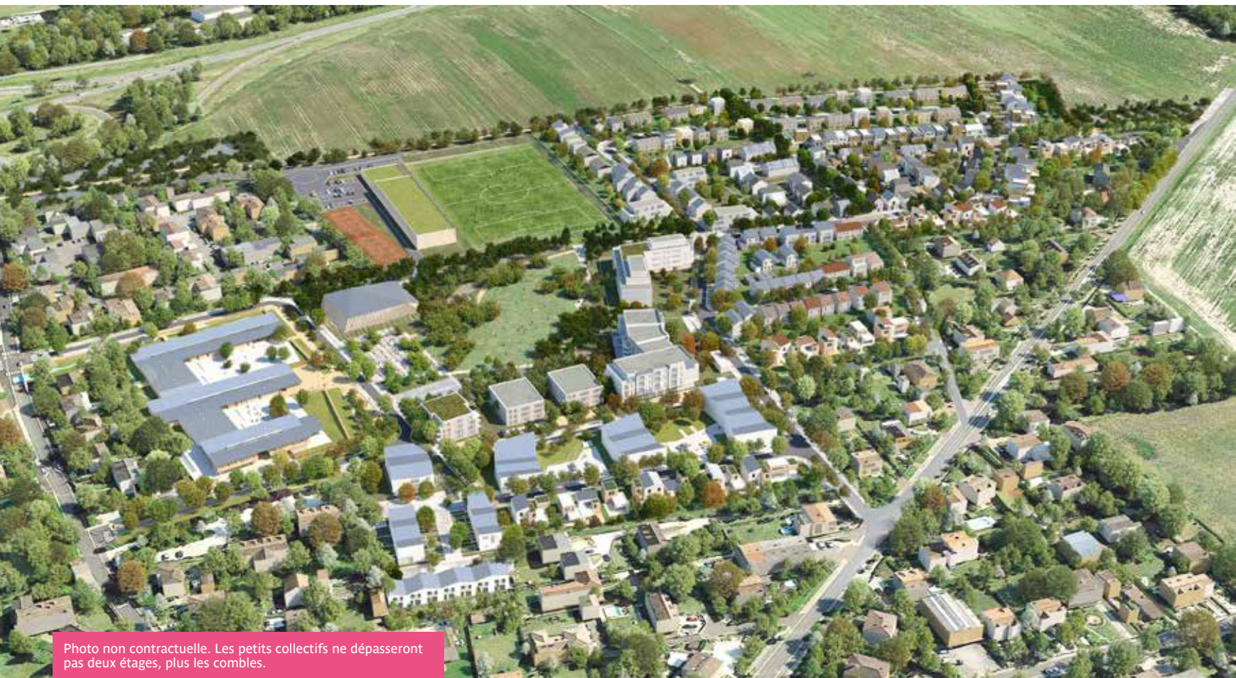
Photo non contractuelle. Les petits collectifs ne dépasseront pas deux étages, plus les combles.

Le 21 janvier 2017 à partir de 11 h à l'Espace BLC :