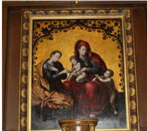
« Le mariage mystique de Sainte Catherine d'Alexandrie » reposé le 22 mars 2016.