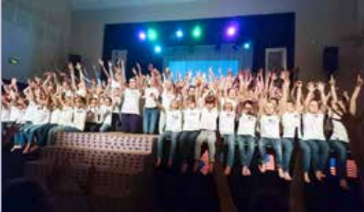
Spectacle de fin d'année les 28 et 29 mai à l'Espace BLC.